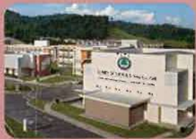
Tenby Schools Ipoh