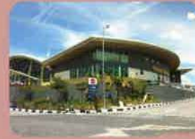
AmanJaya Bus Terminal