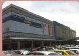
MyDin Shopping Centre